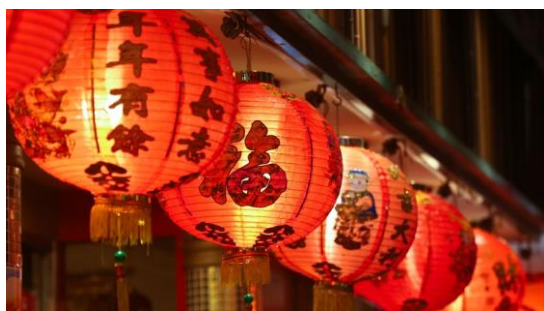
Le nouvel an chinois le 22 janvier