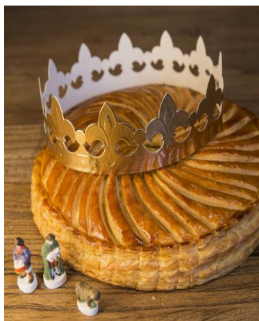
La Galette des Rois le 8 janvier